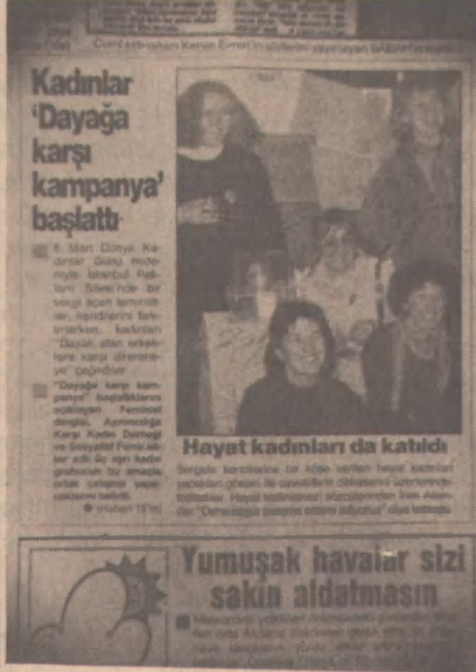
SABAH gazetesinin 8 Mart 1988 sayısı

Feministlerin varlığı karşısında duyduğu telaşı en çok ele veren kurumlardan biri basın. 'Renkli'siyle 'renksiz'iyle, 'naylon'uyla 'say-gın'ıyla, basın, kadınların erkek egemenliğine karşı verdikleri müca-deleyi engellemek için kendi payına düşeni yapacağını sık sık ortaya koyuyor. Kendisine 'saygınlığı' yakıştıran basın organları, tepkilerinde müstehzilikle görmezlikten gelme arasında bocalıyorlar. Erkek egemen burjuva toplumunun çarkları dışında kalanlara, bu topluma karşı farklı düzeylerde mücadele