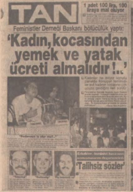
TAN gazetesinin 22 Mayıs 1988 sayısı:

Erkek egemen toplumun çeşitli kurumları, kendilerine uygun gördükleri üsluplarla bu 'illet'e karşı önlemlerini alma hazırlığına girdiler.